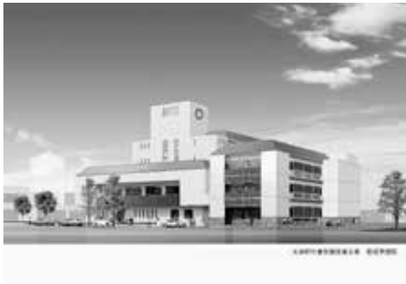
【庁舎別館完成予想図】