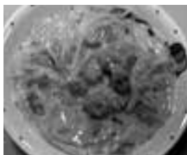
白菜とウィンナーのカレー煮込み