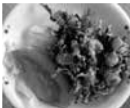
ヒジキと大豆のかき揚げ