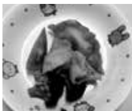
里芋のカレー餃子