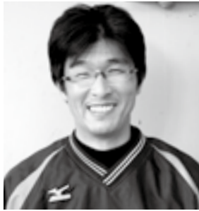
平成19年度当時： 大洲南中学校 3年2組担任