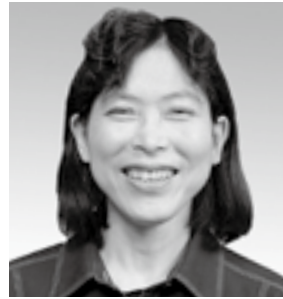
平成19年度当時： 長浜中学校 3年2組担任

またいつの日か、みなさんとお会いできることを楽しみに、心よりご活躍を祈っています。