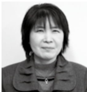
平成19年度当時： 肱川中学校 3年担任