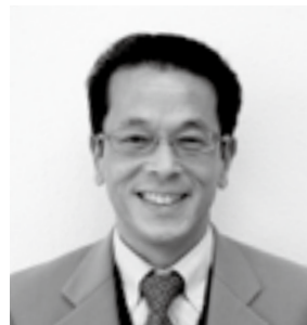
平成19年度当時： 河辺中学校 3年担任

あの頃は、たくさんの感動をありがとう。これから生きていく道でも、あなたたち一人ひとりの温かい光を灯し続けていってください。これからも、ずっと応援しています。次に会える時を楽しみにして。