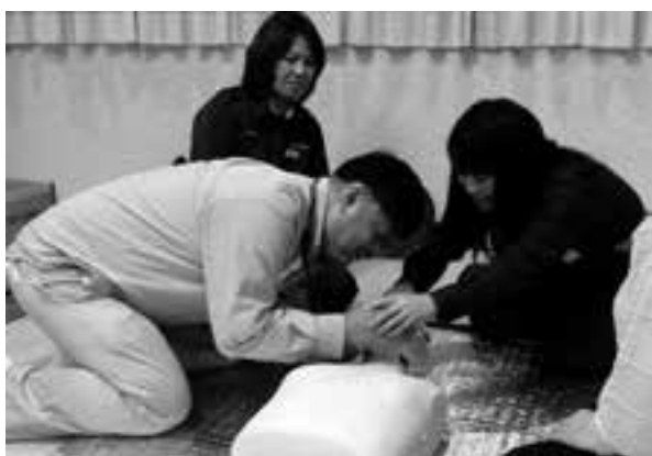
応急手当指導（AED取り扱い訓練ほか）