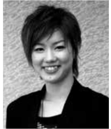
大洲市出身のタカラジェンヌ