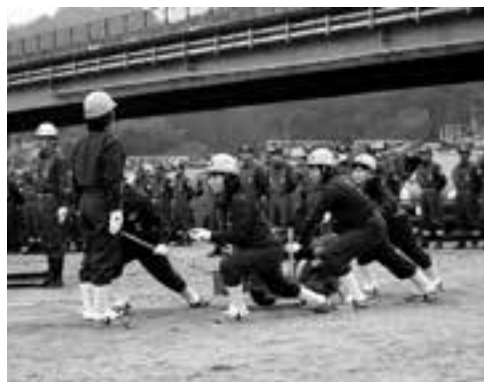
出初式での軽可搬ポンプ操法披露