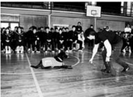
息の合った連携を熱心に見入る生徒たち

大洲市社会福祉協議会と日本盲導犬協会島根あさひ訓練センターとの共催により、盲導犬学校キャラバンが開催されました。