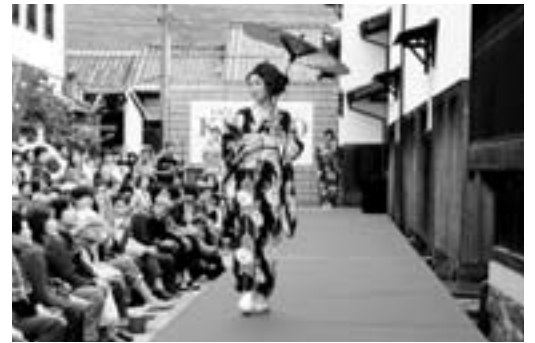
観客を魅了するモデルたち

ファッションショー以外にも、花嫁道中や女子アナウンサーによるトークショーなども行われ、大洲の町をにぎわす1日となりました。