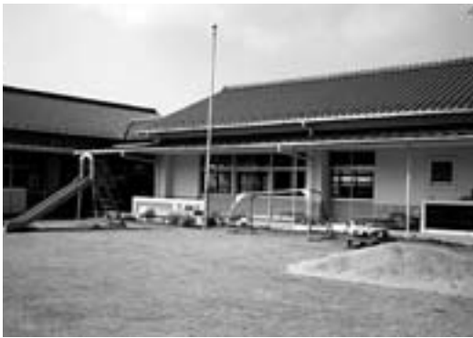
芝の生え揃った大洲幼稚園