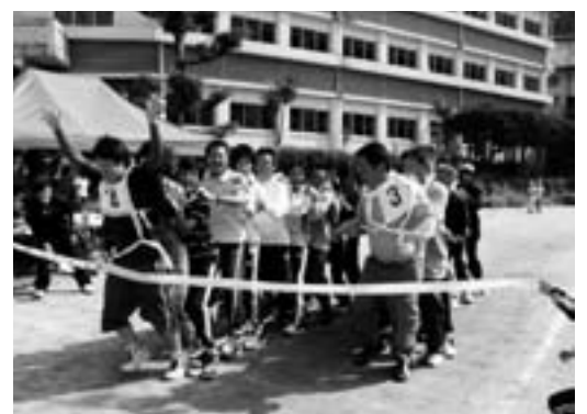
どの種目も接戦に次ぐ接戦となりました

今年度は最後まで優勝争いが続き、接戦を制した正山分館が見事総合優勝を果たしました。