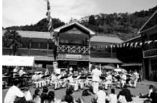
愛媛県警察音楽隊による演奏

今年もさわやかな秋空のもと、多数の来場者があり、ふるさとの宿では、各種出店、文化協会や幼稚園、小学校の発表会のほか、内子高校郷土芸能部OB・OGで結成されている「和達」のみなさんによる太鼓演奏、愛媛県警察音楽隊の演奏が披露されました。ふるさと生活館では、書道、絵画、陶芸、押し花など多くの作品が展示され、またお楽しみ抽選会、健康づくりコーナー、大洲警察署による振り込め詐欺防止などの啓発、パトカー・白バイの展示、林業機械の展示販売など、盛りだくさんの催しに、来場者は楽しい1日を過ごしていました。