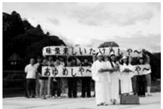
今年こそ3度目の大賞を狙います!

審査会は来年の2月に開催され、大賞に輝いたCMは年間200回、放送されることとなります。