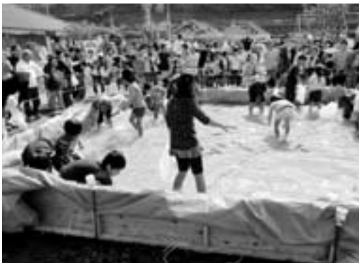
うなぎを追いかける子どもたち

今坊しおさい広場としおさい館で、「今坊ふれあい祭り」が開催されました。これは、地域住民の交流と活性化のため毎年開催されているイベントで、今年で18回目を迎えるものです。