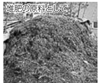
堆肥の原料として