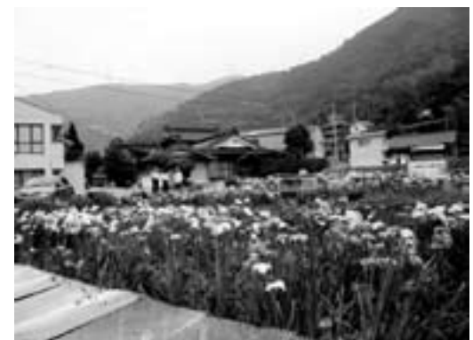
丹精込めて育てられたハナショウブ

祭り終了後も県内各地から愛好家が訪れ、色とりどりのハナショウブを堪能していました。