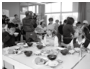
櫛生小学校の様子