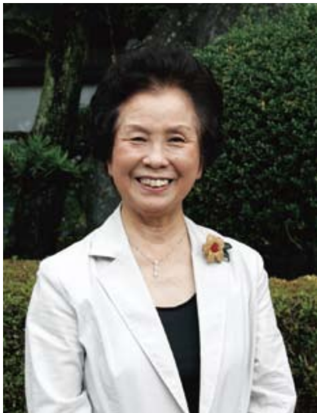
大洲市連合婦人会