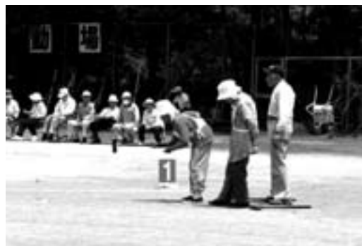
暑さにも負けず元気にプレーする選手のみなさん

梅雨に入り天候が心配されていましたが、当日は晴天に恵まれ、参加者たちは元気よくプレーを楽しんでいました。