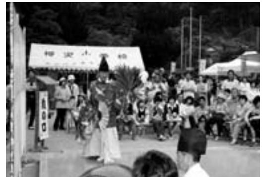
華麗な舞を披露する藤縄神楽

今年は5月になっても気温の低い日が多く、ほたるが飛んでくれるか心配されましたが、矢落川沿いではたくさんのほたるが見られ、訪れた人を楽しませていました。田処会場では、ほたるボランティアガイドによるお接待もあり、好評を博していました。