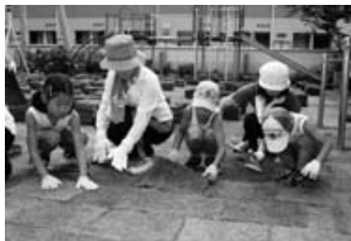
芝生を丁寧に並べていく園児たち

大洲幼稚園で園庭の芝生化作業が行われました。これは、園児がのびのびと安全に安心して遊ぶことのできる環境整備と、降園後の園庭を地域住民に憩いの場として提供することを目的に実施したものです。