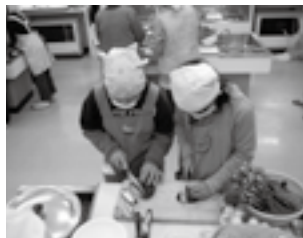
河辺小学校の様子

採れることが分かった」など、地元食材についての知識を深めていました。 今年度は、昨年度に引き続き河辺・櫛生小学校、新たに菅田小学校でも開催する予定です。