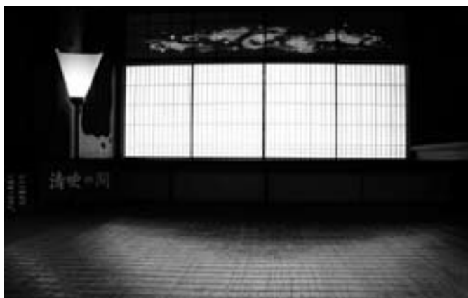
障子に浮かび上がる桜の花と筏

「おもてなしの心」を大切に 臥龍山莊がミシュラン・グリーンガイドに選定されたことは、とても名誉なことで、私たちスタッフも身の引き締まる思いです。 ここに訪れる観光客のみなさんに気持ちよく過ごしていただくために、気さくに声をかけたり、笑顔で接するよう、「おもてなしの心」を大切にしています。 「素晴らしかった」「よかった」という感想をよくいただきますが、どこがよかったのかは、訪れた人さままで、臥龍山莊の奥の深さに