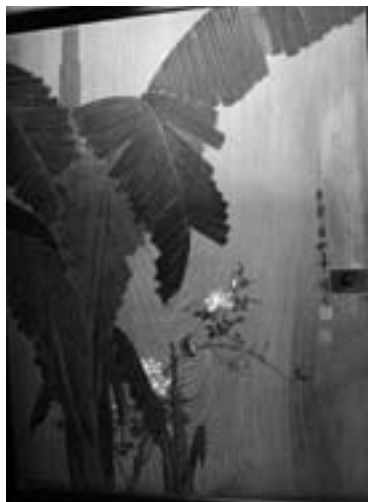
杉の1枚板に大胆な構図の絵が描かれている