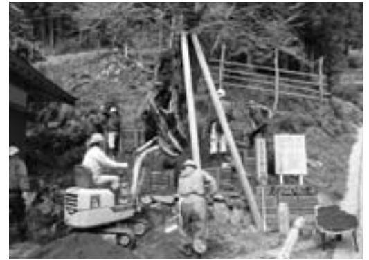
樹木医の指導を仰ぎ作業に取り組む地元のみなさん