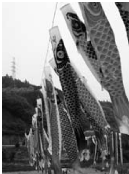
肱川を舞台に設置された鯉のぼり

今回の収益の一部は、東日本大震災で被災されたみなさんを応援するため義援金として寄付されます。