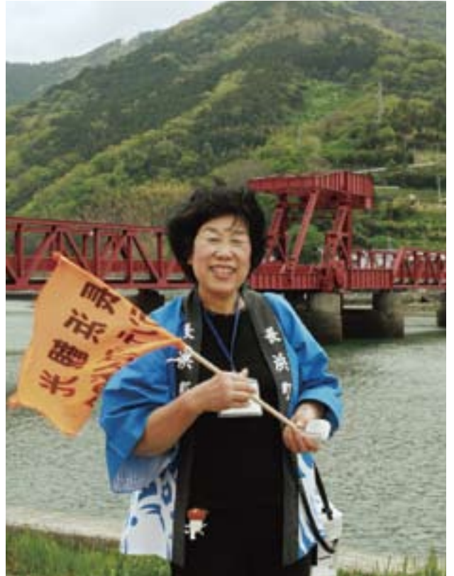
長浜観光ボランティアガイドの会