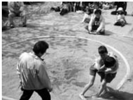
はっけよい！のこった！

今回の経験で得た頑張りやを忘れることなく、子どもたちには白滝を支える元気の源になってほしいと願っています。