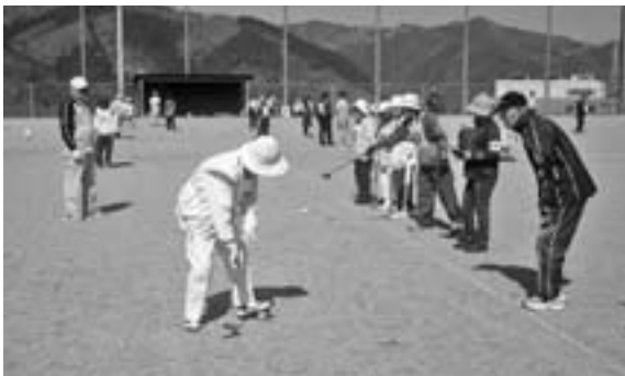
真剣な表情でプレーする参加者

第16回しゃくなげまつりゲートボール大会が、肱川町の大駄場ふれあい広場で開催されました。大洲市内はもとより、伊方町や鬼北町からの参加もあり、全25チーム155人による熱戦が繰り広げられました。