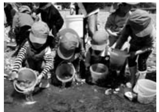
稚鮎を優しく川に放す子どもたち

稚鮎の放流は、毎年この時期に行われるもので、8センチほどの稚鮎は漁の解禁となる6月には約20センチの大きさまで成長します。