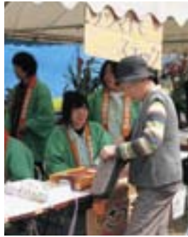
毎年たくさんの方がイベントを楽しむ