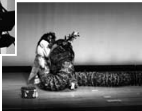
▶ 演舞を披露する 山鳥坂鎮縄神楽保存会のみなさん