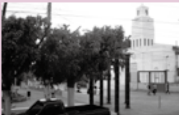
▲街の中心にある公園と教会

私は、エルサルバドルのウスルタン県ベルリン市にあるメアルディ小学校で活動しています。ベルリン市は、エルサルバドルのちょうど真ん中くらいにある街で、標高が1,000mほどあるおかげで、一年中涼しく過ごしやすい気候になっています。街の真ん中には、最近改修工事が終わったばかりのきれいな公園があり、住民の憩いの場となっています。また、コーヒーの産地としても有名で、カフェでおいしい