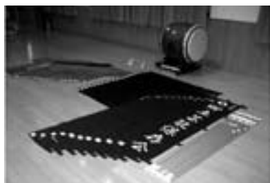
▲整備された祭り用具