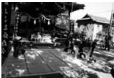
▲秋祭りでの上演の様子