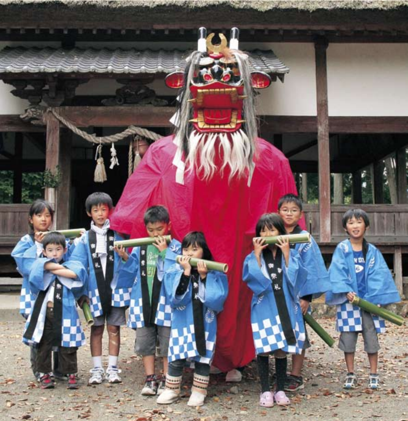
肱川地区で「子ども牛鬼」が製作され、お披露目されました。 (関連記事を19ページに掲載)