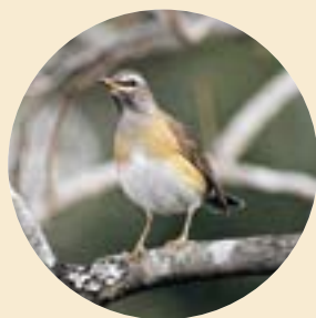
かわうそ復活プロジェクト② NPO法人

朝夕の冷え込みも一段と強まるころ、熟したムクの実や柿の実などに集ってくる旅鳥です。出遭うときはほとんど、シロハラやアカハラといったほかのツグミ類と群れをなしています。今年のように気候の大きな変動があっても、必ずこのころになると渡りを始め、日めくりのカレンダーや地図を持たなくても毎年現れる彼らを見てみると、文明とは何か、高等生物とは何を指すのか疑問を抱かせます。元来、人々も持ち合わせている五感を機械だけに頼って使わない現代人は、もったいないような気がするのには、私だけでしょうか。