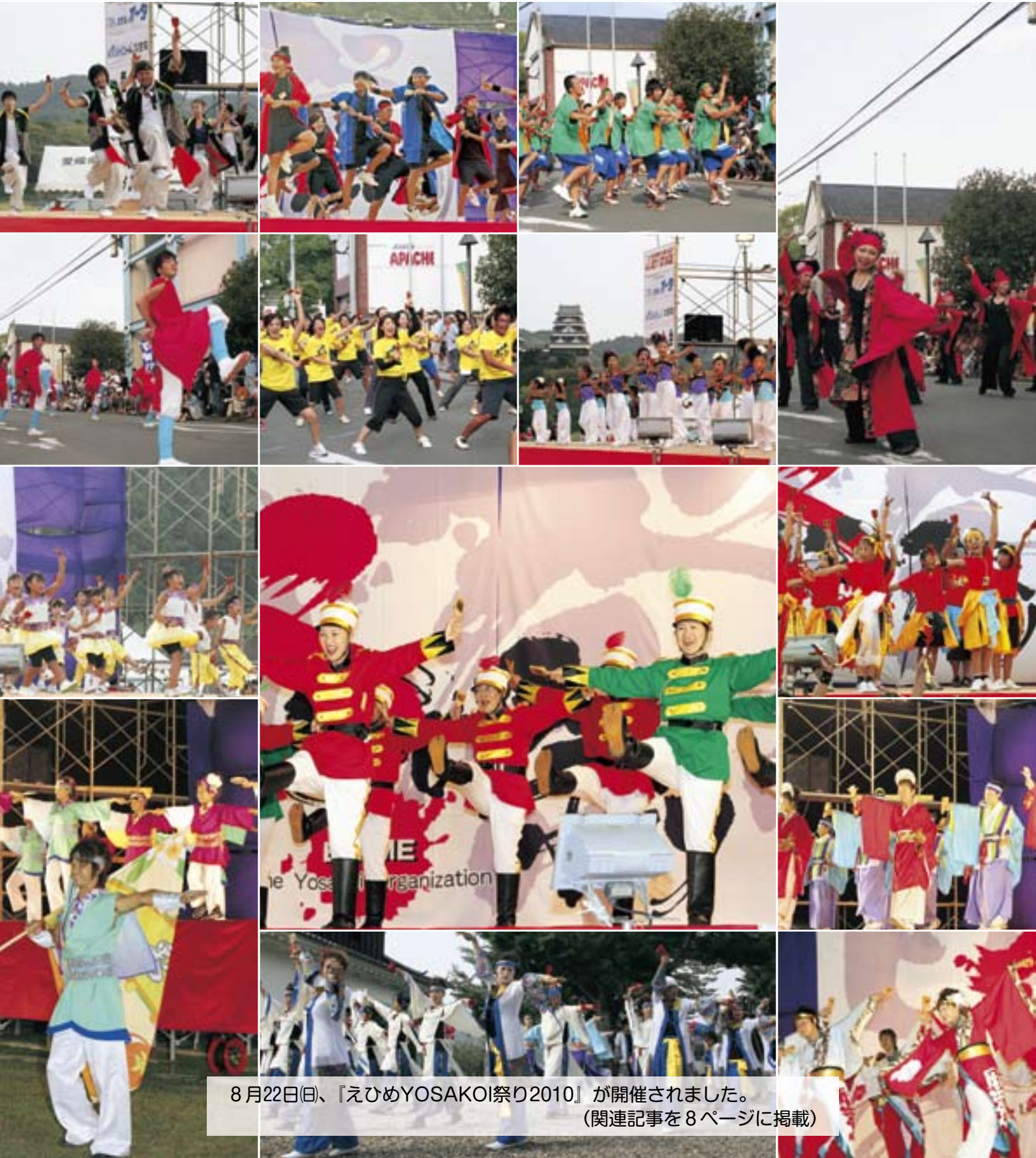
8月22日(日)、『えひめYOSAKOI祭り2010』が開催されました。 (関連記事を8ページに掲載)