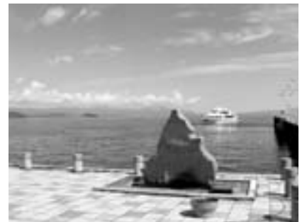
▲琵琶湖周航の歌記念碑