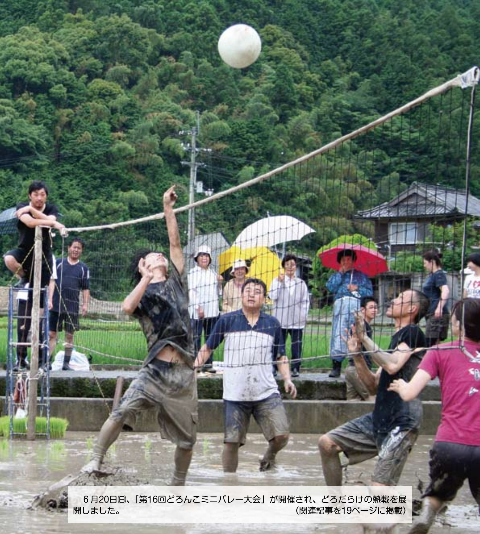
6月20日(日)、「第16回どろんこミニバレー大会」が開催され、どろだらけの熱戦を展開しました。 (関連記事を19ページに掲載)