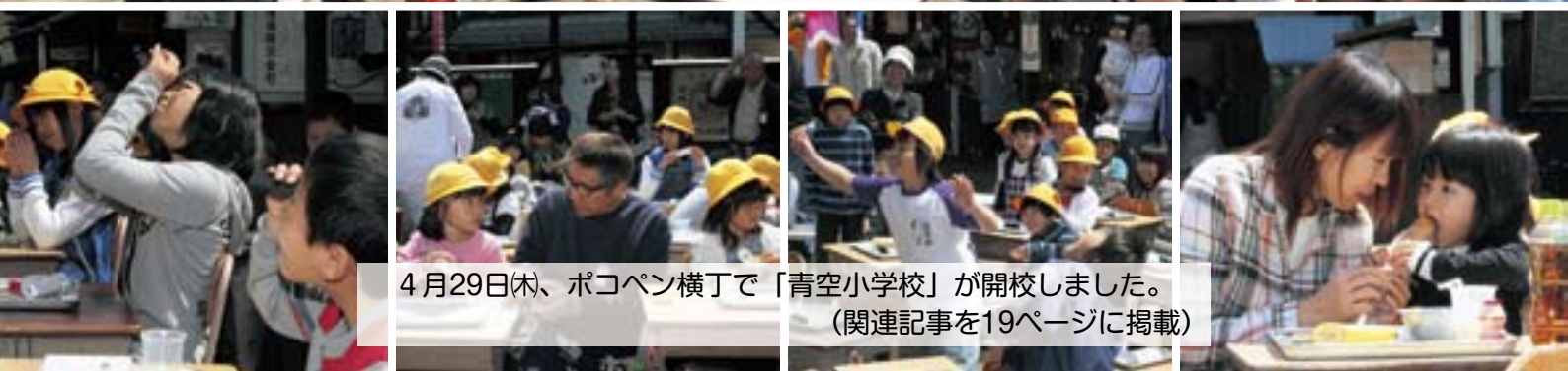
4月29日(木)、ポコペン横丁で「青空小学校」が開校しました。 (関連記事を19ページに掲載)