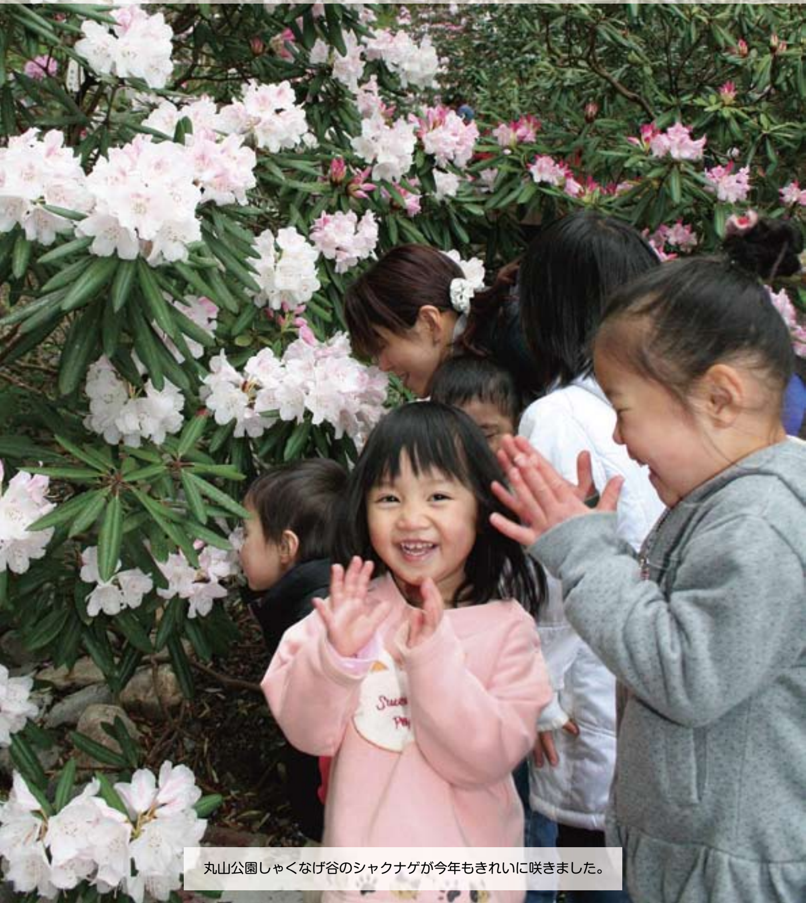
丸山公園しゃくなげ谷のシャクナゲが今年もきれいに咲きました。