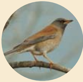
シロハラ(百腹) スズメ目ツグミ科 大きさ25cm

見ごろ さくら・・・3月下旬～4月上旬 しゃくなげ・・・4月上旬～中旬 つつじ・・・5月上旬