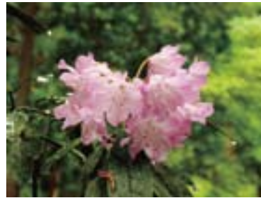
特選：小川浩三 「雨のシャクナゲ」