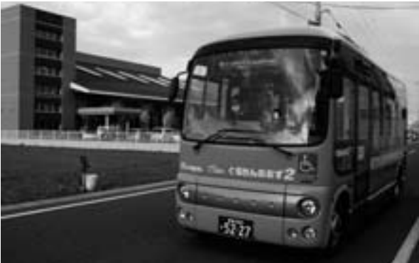
▲市内を走るぐるりんおおず

皆様にご利用いただいております市内循環バス「ぐるりんおおず」は、4月1日から時刻表が改正されます。また便数も、今までの左回り4便、右回り4便の1日8便からどちらも2便ずつ増便され、計12便で運行されることになりました。 市民の皆様には、高齢化社会にも対応し、環境にも優しい公共交通について理解していただき、親しみをもって多くの人に利用していただきたいと思います。 また、これまでどおり松ヶ花(大洲記念病院前)ー大