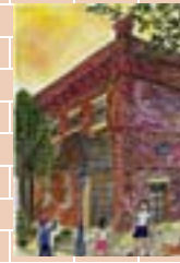
◀中学生の部 最優秀作品 井上 侑香