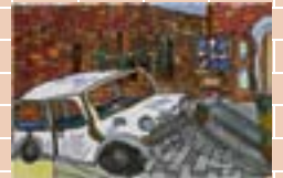
▲小学生高学年の部 最優秀作品 上岡 浩基