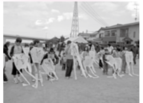
▲凧あげ大会スタート

午前11時には、凧あげ大会がスタート。参加者は、周りからの声援を受け、手作りの凧を空高く上げていました。大人も子どもも元気いっぱい走りまわり、素晴らしい1年のスタートをきりました。