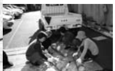
竹のプランター作りワークショップ（緑化推進事業）