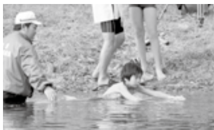
▲寒さをこらえて水の中へ