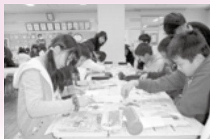
▲ピンセットを使って慎重に…

参加した園児や児童らは、保護者と一緒になって、ピンセットを使い慎重に自分の気に入った押し花を台紙に載せ、最後にラミネーターでプレス。お気に入りの作品が出来上がりました。参加者は「普段、何気ない草花がこんなに美しい作品になるなんて」と、感動していました。