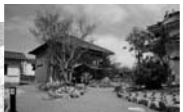
大洲城南隅公園（＝現・お殿様公園）整備事業