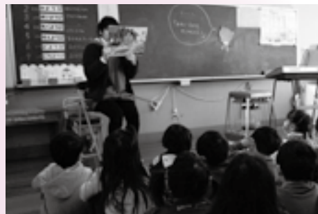
▲紙芝居で節分について学習する園児

発表が終わると早速園庭へ。豆をまく役と鬼さん役とを仲良く交代しながら、元気に豆をまきました。交代し終わると、「ウォーッ!!」崖の上から本物の鬼が?!大きな叫び声に、一瞬ひるんだ子どももいましたが、そこは元気あふれる園児たち。すぐに気を取り直すと、力強く豆をまいて大きな鬼も退治しました。めでたしめでたし……。