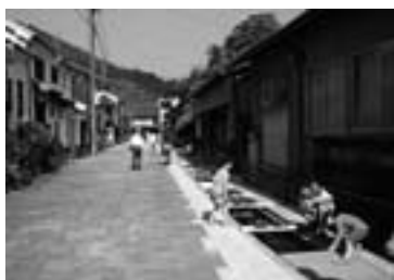
水と緑のネットワーク整備事業 【おはなはん通り】