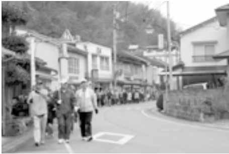
▲元気よく歩く参加者ら