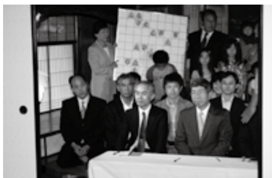
▲「大洲迷人戦」撮影時のようす

「ドラ・コミ・なんよ」の作品は、過去4回のうち大賞を2回、奨励賞を1回受賞しています。