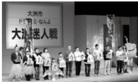
▲審査会で作品を発表する「ドラ・コミ・なんよ」のみなさん

今回の大会は、県内19市町から出品された作品のうち25本が予選を通過し、大洲市からは、「ドラ・コミ・なんよ」が制作した作品「大洲迷人戦」が、審査会に臨みました。