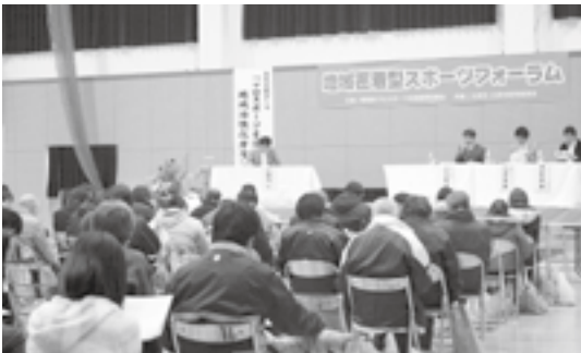
▲活発な意見交換が行われました

集団検診は終了しましたが、医療機関(産婦人科)での個別検診の実施期限は2月28日(日)までになっています。該当者の方でまだ受けていない人は、忘れずに受けましょう！