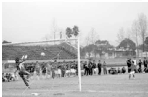
▲練習の最後には、PK対決で楽しみました