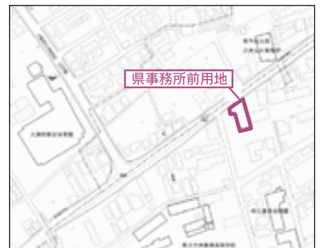
[県事務所前用地 位置図] 財団法人大洲住宅協会所有地