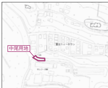
[中尾用地 位置図] 大洲市土地開発公社所有地