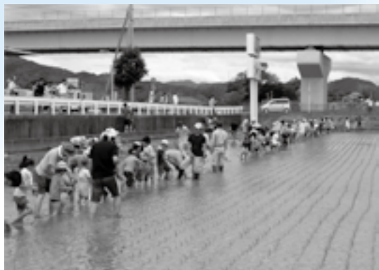
▲みんなで1列になって

なトマトや茄子などが参加者全員にプレゼントされ、参加者は笑顔を見せました。秋には収穫体験も開催され、参加者には精米したお米がプレゼントされるそうです。