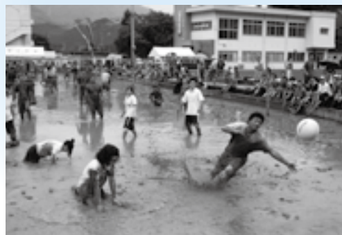
▲懸命にボールを追う選手