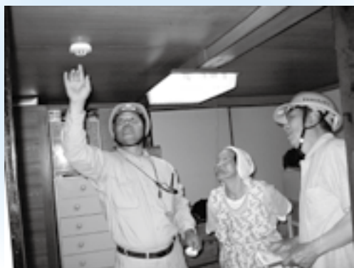
▲これで、ひと安心ですね

今年の大会には、柴、白滝小学校の2チームと一般参加24チームの合わせて26チーム、約200人が参加。白線の代わりに苗が植えられたコート3面で熱戦が繰り広げられました。試合は10分間で多く得点したチームが勝ちです。選手は、泥に足をとられながらも必死でボールを追いかけて、観客からは大きな声援と笑い声があふれていました。