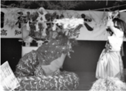
▲地域の文化を披露