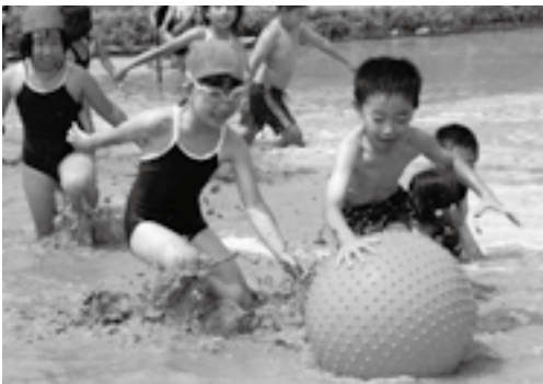
▲ゴールを決めるのは誰だ！