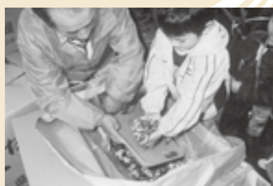
▲すくいどりのようす