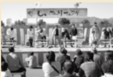
▲昨年のフェスタのようす

しいたけ駒打ち体験・しいたけすくいどり・しいたけ炭火焼・餅まき、お菓子まき その他