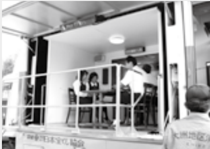
▲地震体験のようす (9月11日 NTT駐車場)

きる「地震体験車」(県所有)があります。 市内でもイベントなどの際に体験の機会を提供しています。また、各地区で実施される防災訓練で使用することもできますので、自主防災組織などを通じて、お問い合わせください。