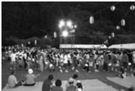
▲みんなで輪になって河辺音頭

お盆の帰省客も多くみられましたが、皆さんふるさとでの楽しいひとときを過ごしていただけたと思います。