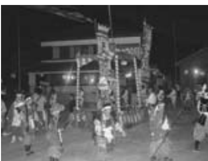
▲輪になって踊る長浜中の生徒

「青島の盆踊り」は寛永16（1639）年、播州赤穂坂越村から移住してきた人々によって踊り継がれており、8月13日に魚の供養と大漁を願う賑やかな「大漁踊り」、8月14日には赤穂四十七士の装束で一年間の死者の霊を慰める「亡者踊り」が踊られています。