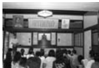
▲至徳堂で話を聞く高島市の小学生

「青島の盆踊り」は寛永16（1639）年、播州赤穂坂越村から移住してきた人々によって踊り継がれており、8月13日に魚の供養と大漁を願う賑やかな「大漁踊り」、8月14日には赤穂四十七士の装束で一年間の死者の霊を慰める「亡者踊り」が踊られています。