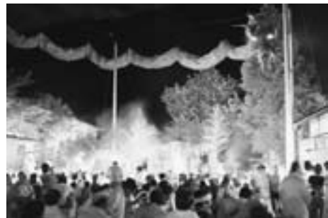
▲上空で舞う青い目の大蛇

がら手のひらに乗せた盆を落とさないように舞うのですが、なかなか難しいようです。思い通りに操れずお盆を落としてしまったりして笑い誘っていました。また、舞台上空には青い目を光らせた大蛇が夜の闇を切り裂いて登場し観客を見下ろしていました。