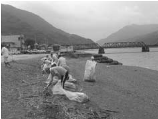
▲長浜赤橋付近で清掃をする参加者

この日3市2町の8カ所の会場に参加したのは、むぎわら帽子や手ぬぐいなど思い思いに暑さ対策をした256人。午前9時にそれぞれの場所に集合すると、ペットボトルや空き缶などを分別しながら