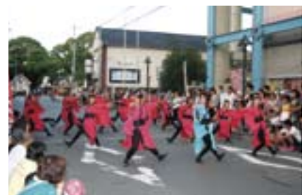
▲4連覇を逃したものの、「静と動」の見事な踊りを披露した 羅り瑠れ櫓連 [えひめYOSAKOI準大賞]