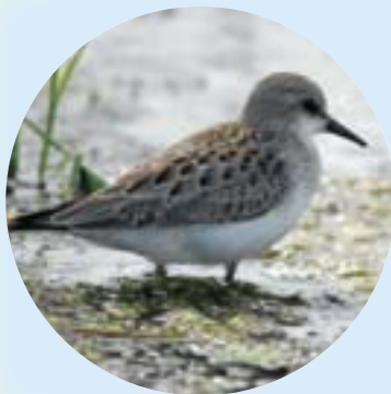
かわうそ復活プロジェクト

北極に近いシベリア北東部で繁殖し、インドシナ半島、オーストラリア、及びニューギニアなどで越冬するスズメ位のシギの仲間です。大洲では渡りの途中に、出会う事が出来ませんが、昨年の早秋は東大洲で長旅の疲れを癒していました。シギ、チドリ類と言えば、海岸で生息するような印象ですが、結構内陸の沼や水田も利用します。休耕田も水を張る事で、多種多様な生き物が命をはぐくみ、オアシスの役目をして野鳥達の楽園になります。ここでエネルギーを蓄え南へ向かう彼らは、きつと「中継地を造ってくれる心優しい大洲の人達、ありがとう」と言っていると思います。