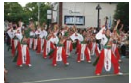
▲しなやかで、躍動感いっぱいの内子高校郷土芸能部女組 [えひめYOSAKOI大賞]