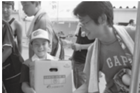
▲喜びのエコラブスイカ 当選者