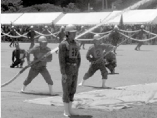
▲正山分団選手が素早く放水を開始

大会では、各選手が競技中の減点を最小限に止めたことに加え、参加チームの平均タイム