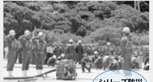
優勝した正山分団