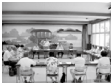
▲河辺地域審議会のようす

地域審議会は、地元の公共的な団体の役職者や学識経験者などが委員となり、新市の建設計画などを審議するもので、市からは地域安全・防災対策や小学校統廃合計画など主要施策についての説明のほか、財政状況や集中改革プランの進捗状況、地上デジタル放送の対策状況などが報告されました。その後の意見交換では、それぞれの地域における課題や問題点について活発な意見交換がなされました。