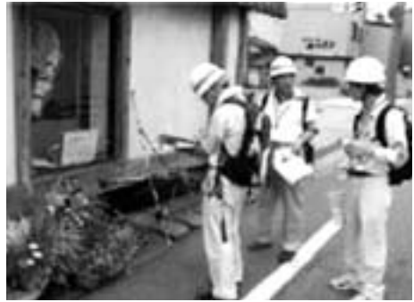
写真：危険度判定状況

不幸にして大きな地震が発生した場合、被災した建物がその後の余震により倒壊したり物が落下して、人命に危険をおよぼす恐れがあります。そのため、人命にかかわる二次的災害を防止することを目的として、被災後すぐに、市町は被害状況を把握し被災した建築物の危険度の判定を実施することが必要であると判断したときは、知事が認めた民間の建築技術者などの協力を得て、被災建物の調査を行い、その建物が使用できるか否かを応急的に判定するものです。