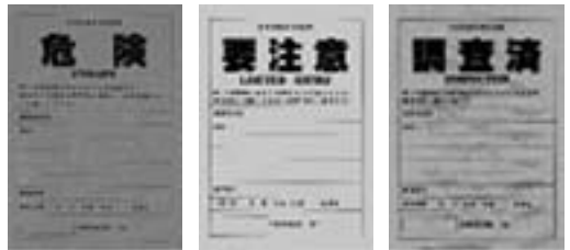
危険度ステッカー

そして調査の結果は、「危険」・「要注意」・「調査済」の3種類のステッカーで、建物の出入口等の見やすい場所に表示し、居住しておられる人はもとより付近を通行する歩行者などに対してもその建物の危険性について情報提供するものです。