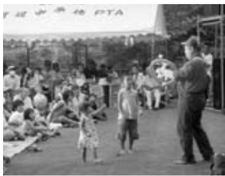
▲次は何ができるかな？