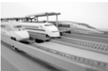
展示室を走る鉄道模型 (運転時間) 10時・11時30分・13時30分・15時30分