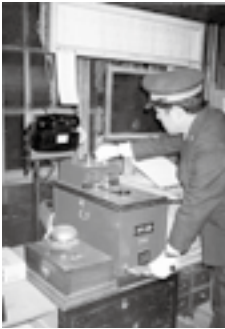
タブレット交換風景 伊予長浜駅

鉄道の歴史や変遷をひも解くことにより、鉄道をより一層身近なものに感じてもらいたいと思います。