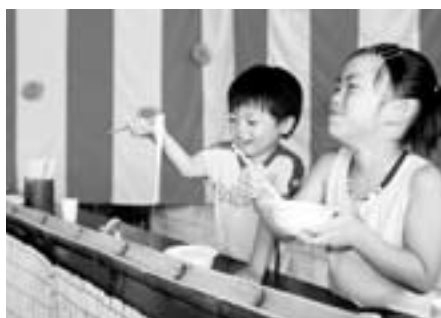
▲わ〜い。流れてきたあ〜。