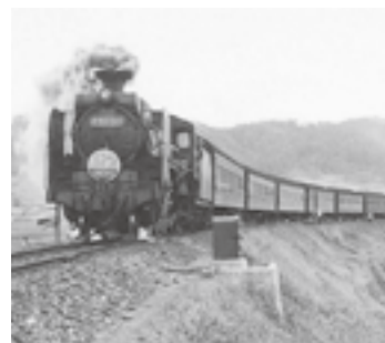
準急せと 『四鉄史』より