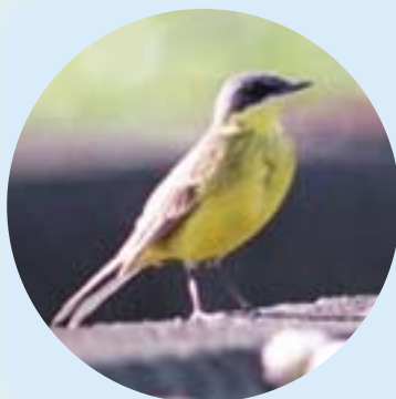
NPO法人 かわうそ復活プロジェクト

日本海側の島嶼部を通過する数少ない旅鳥ですが、平成17年の5月に東大洲でも観察されました。愛媛県ではごくまれな野鳥で、今までに数例しか記録がありません。良く見かけられるキセキレイと良く似ていますが、お腹がすべて黄色で尾羽が短い事などが特徴です。日本では4亜種が知られており本種はユーラシア北部で、キマユツメナガセキレイのみ北海道北部で繁殖が知られています。自由に空を飛び国境を持たず何処にでも立ち寄れる彼らを見てみると、うらやましくも有り人間社会も見習うところが多いような気がします。