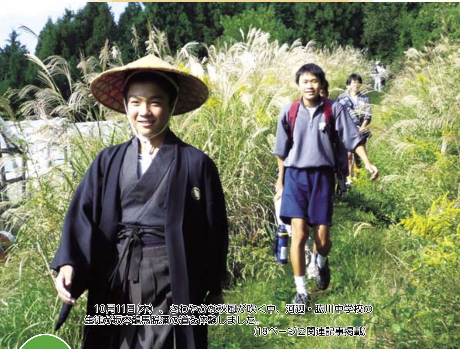
10月11日(木)、さわやかな秋風が吹く中、河辺・肱川中学校の生徒が坂本龍馬脱藩の道を体験しました。 (19ページに関連記事掲載)