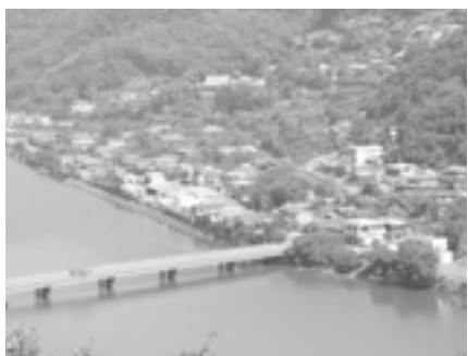
地区計画の指定が見込まれる上老松地区