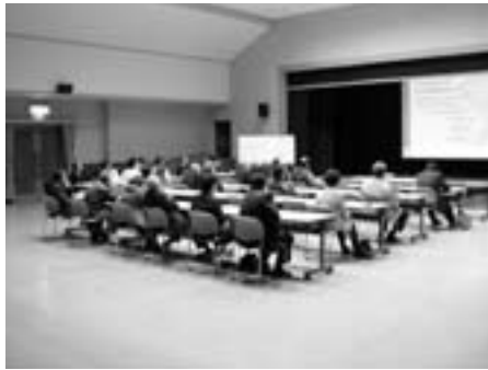
▲ 3月に開催した素案説明会(大洲市総合福祉センター)