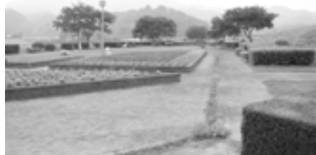
▲みんなの公園です。ルールを守って利用しましょう。

ご連絡・問い合わせ先 市役所都市整備課都市計画係 ☎2421111（内線246）