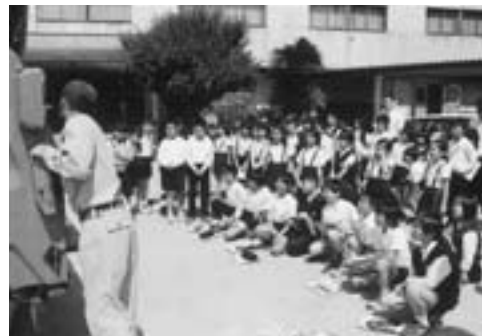
▲ごみ収集車の仕組みについて学ぶ児童たち