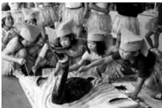
▲ていねいに色付けする園児たち

【問い合わせ先】 市役所企画調整課 男女共同参画係 ☎24-2111 (内線522、524)