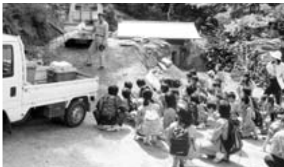
▲炭焼きについて説明を受ける児童たち

児童らはお土産にもらった炭を手に取り、冷蔵庫の脱臭剤や金魚の水槽の浄化など、さまざまな使い方を考えていました。