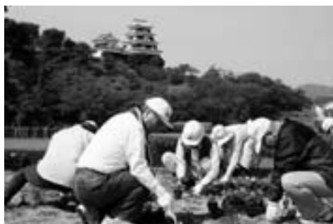
▲植栽作業に精を出す会員ら(肱北緑地公園)

6月1日から始まるうかいを前に、来訪客に潤いと安らぎを提供しようと、うかいの屋形船が着く肱南船着場の花壇や肱川緑地公園に、色とりどりの花が植栽されました。