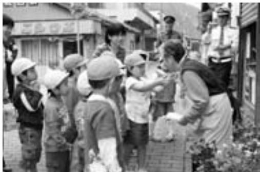
▲交通事故防止を呼びかける園児たち