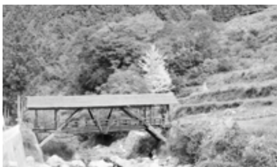
▲ 河辺浪漫八橋の一つの帯江橋