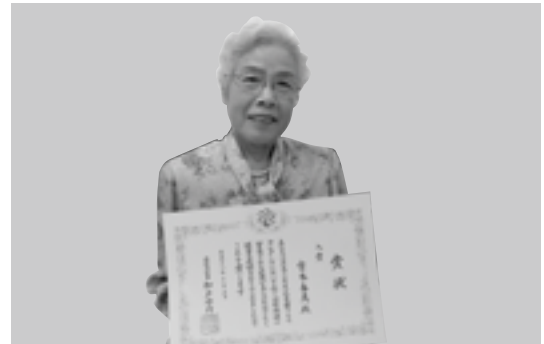
元気歯つらつコンクール入賞者

また、高齢者を対象とした介護予防活動の一環として、歯だけでなく口腔機能の維持改善にも重要な役割を果たされています。