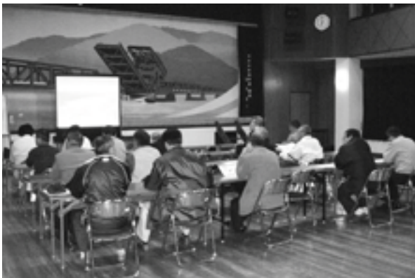
長浜地域の説明会 (3月9日)

長浜地域の説明会には20名が参加し、参加者からは、各種施設整備に加えて若者定住対策が必要といった意見をはじめ、高齢者に優しい施設整備や地域が良くなる景観計画作りなどの要望が出されました。