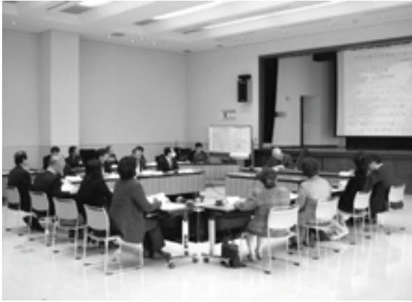
2月26日に開催された第3回の策定検討委員会

《清流肱川が結ぶ山・川・海と歴史に包まれた快適活動都市大洲》に設定されました。また、基準年次の平成17年から10年後(平成27年)の大洲市の目標人口は、上位計画の大洲市総合計画に基づいて50000人と設定され、20年後(平成37年)の目標人口は、10年後の目標人口を基に