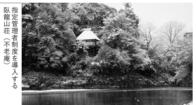
指定管理者制度を導入する臥龍山荘（不老庵）

で管理していた経費と利用料金との差額等を考慮した金額を考えており、大洲城は220万円程度、大洲家族旅行村は780万円程度を想定している。なお、臥龍山荘については観覧料のみで管理費が賄える見込みであるため、指定管理料の支払いは考えていない。