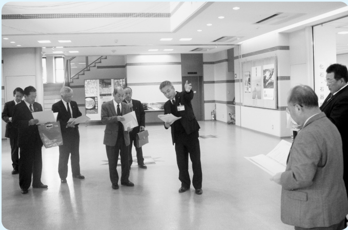
厚生文教委員会（肱川風の博物館）