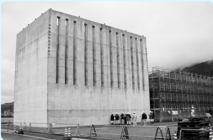
建設農林委員会（長浜港で建設中のケーソン）