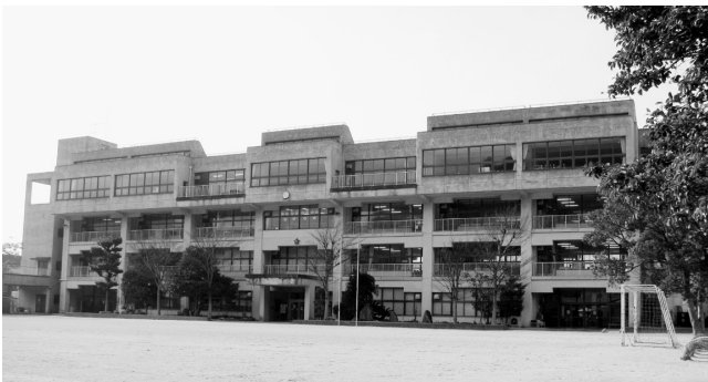
耐震化補強工事予定の長浜小学校

なる耐力度調査により改築が必要な点数になったため、改築に向けての作業を進めているところである。優先度2の長浜小学校、喜多小学校については2次診断を実施し、長浜小学校については診断結果が出たため、耐震補強工事の設計を完了したうえで工事に取り掛かる予定である。また、市内全域の学校耐震化工事については、優先度1から3の校舎または体育館から速やかに着手し、できる限り前倒しで進めていく考えである。