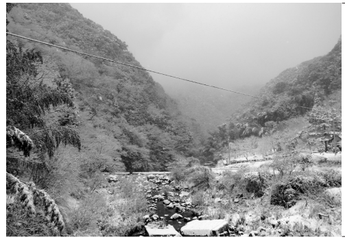
山鳥坂ダム建設予定地の 肱川町京造地区

源地域整備計画案を固められ、平成21年6月に国に対して法手続となる水源地域指定の申請が行われていま