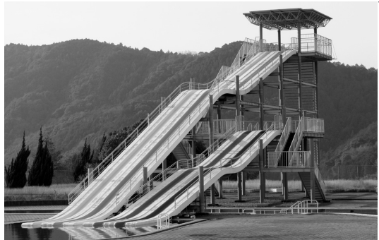
補強工事を行う「スライダープール」

説明 運動公園内プール施設「スライダープール」は昭和56年度に建設されて以来、市内の子どもたちを中心に、夏休みの楽しみとして親しまれてきたが、耐震診断を行った結果、指標値を下回る結果となったため、補強工事等を実施する事務組合へ負担するものである。