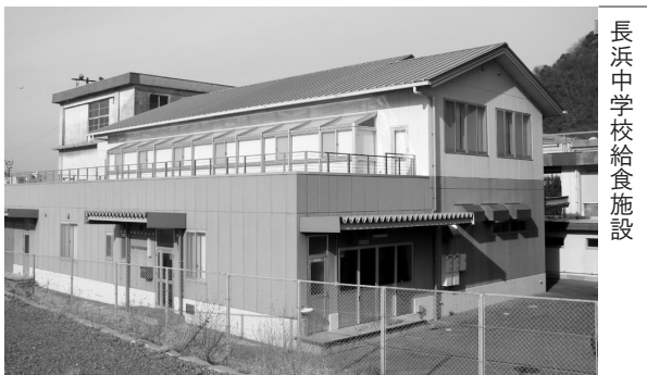
長浜中学校給食施設

PFI手法の検討の中でも献立の作成や食材の調達、検収などは現在のセンターと同様に市が実施することとしており、すべてを民間事業者にゆだねるものではありません。