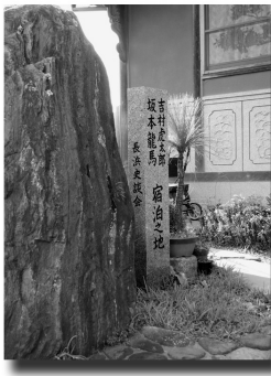
坂本龍馬宿泊地（長浜）

修復後の維持管理については、同じく国の登録有形文化財となっている旧加藤家住宅主屋のあるお殿様公園と同様に、地域の皆様の