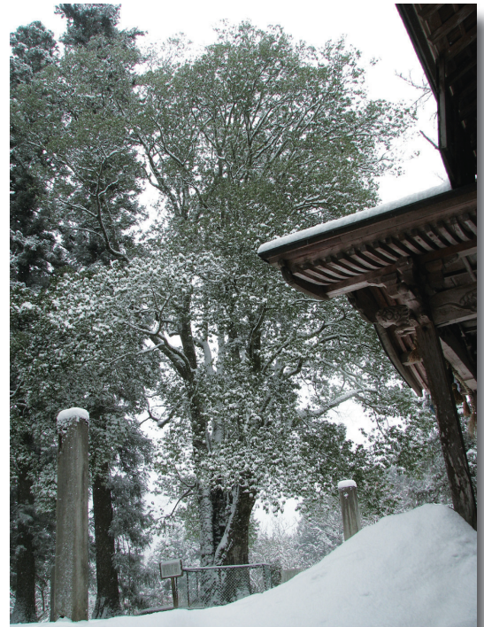
三嶋神社のシラカシ(県指定天然記念物・河辺町)