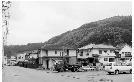
住宅地が密集する柚木地区

による如法寺地区の河川改修、県による樋門工事、大洲市による止水壁等を役割分担しながら実施しており、