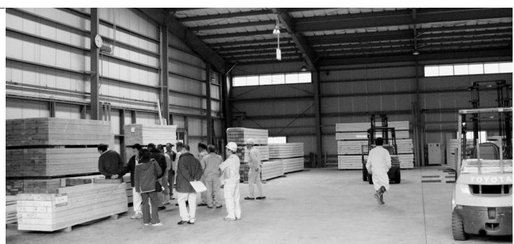
八幡浜官材協同組合の現施設（建設農林委員会管内視察）