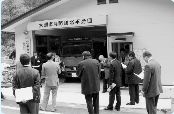
総務企画委員会（消防団北平分団詰所）