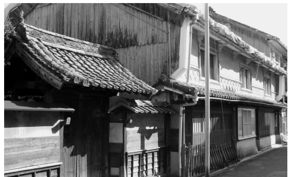
末永家住宅の主屋(右)と百帖座敷(左)

今年度に入り、長浜地域ではこれらの建物の保存活用について検討するため、長浜歴史遺産保存会を設置されるなど、貴重な歴史的、文化的遺産を保存し、地域づくりに活用しようという積極的な取り組みがなされており、こうした実情を踏まえ、建物の修復並びに活用等について総合的に検討するため、庁内関係部局で組織する旧末永家住宅修復に伴う検討会を設置したところです。 修復、保存に際しては、建築基準法などの法的な問題、あるいは修復の内容によって文化庁など関係機関への協議なども必要になってくることから、これらの