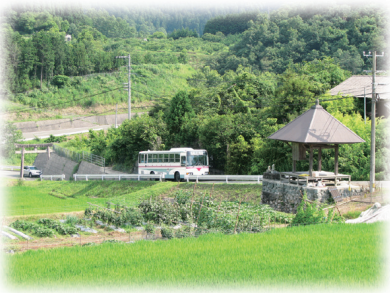
「愛農塾」農園付近(肱川町)