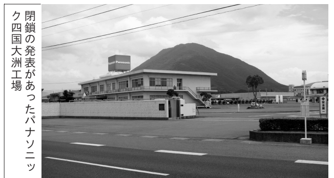
閉鎖の発表があったパナソニック四国大洲工場

当市では、10月末に撤退するという最悪の事態も想定しておく必要があることから、副市長をトップにした企業誘致対策会議を設置し、撤退した場合の跡地利用、新たな企業誘致等も含