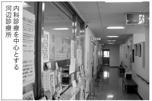
内科診療を中心とする 河辺診療所

とから、内科の存続を最優先課題として取り組み、歯科については廃止を含め地域住民や関係機関等と十分協議し、慎重に検討していきたいと考えています。