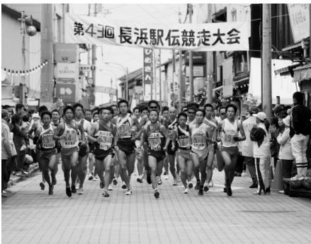
商店街を走る選手たち (長浜駅伝競走大会)

審議の結果、長浜の晴海ふれあいパークをスタートし、長浜本町商店街を通り、脇川左岸部をメインコースとして大洲市民会館をゴールとする新コースで実施することになったものです。