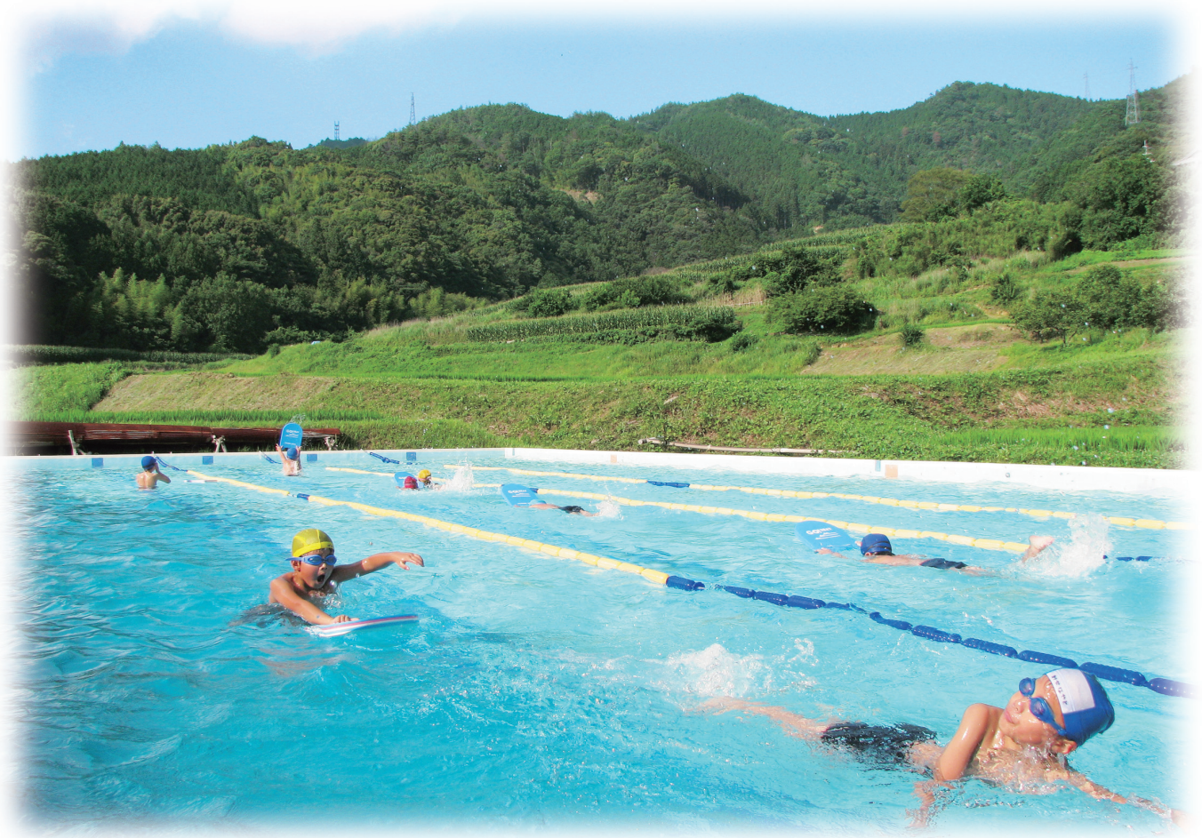
水泳大会に向けて（予子林小学校）

●発行 大洲市議会 〒795-8601 愛媛県大洲市大洲 690 番地の 1 ☎0893-24-1730 FAX0893-23-1121