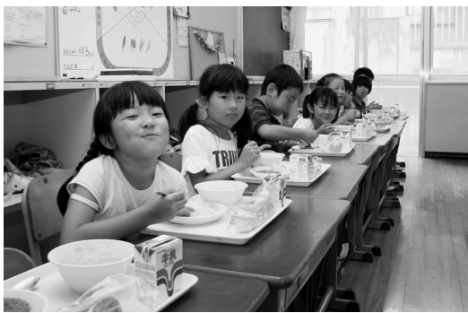
毎日楽しみの学校給食 (南久米小学校)

答 大洲市食育推進計画では地産地消の推進のため、大洲の伝統的な食文化を継承した献立を取り入れ、特色ある農水産物の普及、安心・安全の食の提供に努めることとしています。地域で生産された安全で季節感のある食材で日本の食文化を伝えられる豊かな給食内容にすることは、食育の推進や地産地消の観点からも大変重要ですので、地産地消拠点施設などの流通機能を有効に活用し、生産者情報の共有化、組織化を図りながら、地元農水産品の取り込み拡大に努めていきたいと考えています。