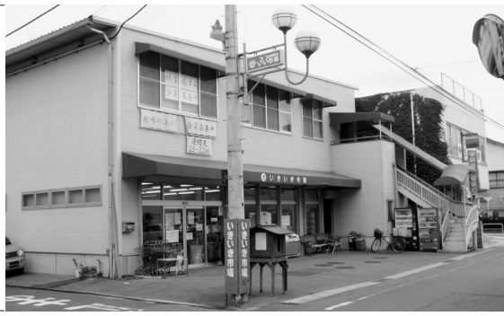
肱北地区の集客事業を担う 大洲いきいき市場

やむを得ないものと判断したものである。また、駐車場の有効活用等については、店舗の管理上、支障がある場合もあるので今後いきいき市場と協議・検討していきたい。