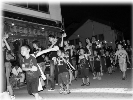
長浜音頭でヨイショー！ （土曜夜市踊り大会）

議会の日程等は、開会の約1カ月前に市ホームページに掲載しています。ご不明な場合は市議会事務局へお問い合わせ下さい。