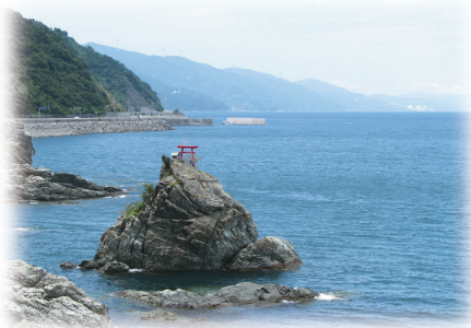
櫛生から伊方町を望む