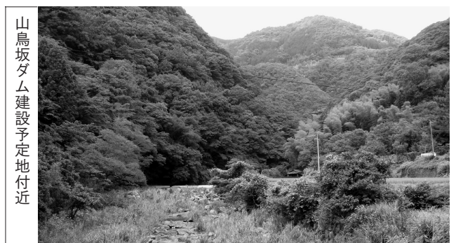
山鳥坂ダム建設予定地付近

答 一般的にダムの洪水調節効果は、対象とする洪水の雨の量や降り方、洪水調節の容量、その他、調節方式等により異なりますが、肱川水系河川整備計画の大洲地点における目標流量毎秒5,000トンの昭和47年9月型洪水に対して、山鳥坂ダムの洪水調節効果は毎秒約400トンと聞いており、今後必要な整備流量である毎秒1,450トンの約30%を占めます。また、山鳥坂ダムの流域面積が少ないのに治水効果が大きい理由としては、山鳥坂ダム流域は肱川流域でも降水量が多いところであること、山鳥坂ダムの洪水調節容量は降った雨の大部分をためることができ、効果の高い洪水調節が行えることなどと同っています。