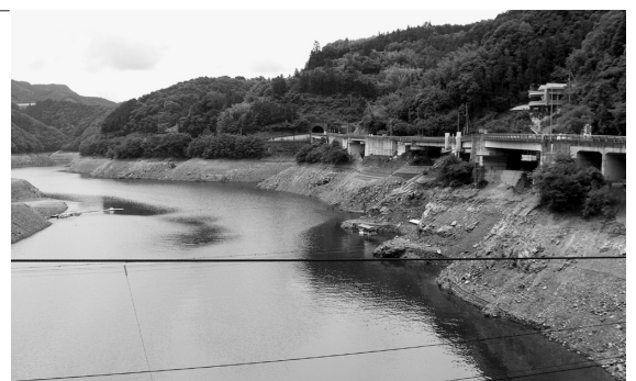
少雨により影響を受けた 鹿野川ダム湖

また、農作物の被害については、山間部の水田において田植えができない状況や、水稲・タバコの生育遅延が見られ、果樹においても果実の生長に影響を及ぼしている状況であり、今後少雨が続けば、被害は拡大すると予想している。一方、水位が低下した鹿野川ダムの放流については、大洲地点での正常流量を割っている状況であり、管理を行う国土交通省に対して、正常流量を維持するために特段の配慮を検討いただくようお願いしている。