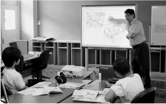
電子黒板を利用した授業 (豊茂小学校)

答 大洲いきいき市場協同組合の経営状況は、計画どおり収益が上がらず、平成20年度の決算においても企業努力はされているものの損失が出ている状況にあるため、貸付料の減額も