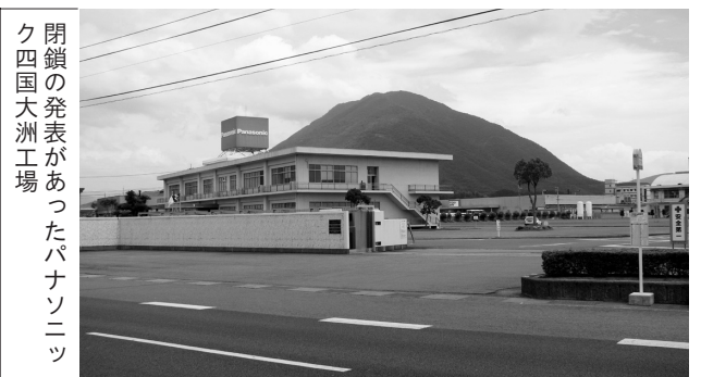
閉鎖の発表があったパナソニック四国大洲工場

当市では、10月末に撤退するという最悪の事態も想定しておく必要があることから、副市長をトップにした企業誘致対策会議を設置し、撤退した場合の跡地利用、新たな企業誘致等も含