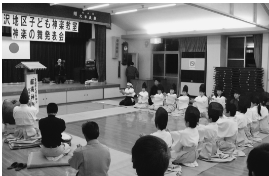
伝統芸能伝承の取組（藤縄神楽）（大洲地区・柳沢小学校）

説明 諸収入の67万円の委嘱金は、「我が国の伝統文化を尊重する教育に関する実践モデル事業」の委嘱金として、国立教育政策研究所からモデル校として受けるもので、大洲市では、柳沢小学校の藤縄神楽、大谷小学校の大谷文楽、榊生小学校の豊年おどり、平