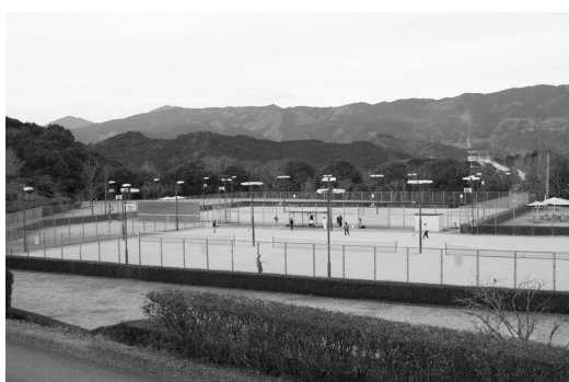
八幡浜・大洲地区運動公園内のテニスコート

答 高齢者の日常生活を支援する中核機関として「地域包括支援センター」を設置するとともに、本庁、長浜及び肱川支所に「サブセンター」を拠点施設とし