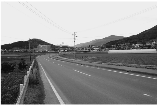
洪水による被害が懸念される菅田地域

最大限の努力を払うとともに、国及び県へも治水事業の推進について、機会あるごとに強く要望していきたいと考えています。