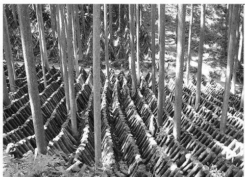
しいたけのほだ木

また、肱川流域林業活性化センターが実施する乾しシイタケを使った料理講習会の開催に共同して取り組みとともに、乾しシイタケを使用した新しい料理の創作や加工品の開発を行い、レシピ集などを活用したPR活動を市内外にも行いながら販路拡大につなげたいと考えています。さらに、地元産食材の利用を推進している学校給食への利用拡大については、生産者連絡協議会とも連携し、市内はもとより県内、県外の小・中学校にも働きかけ、また良質の原木乾しシイタケだけを厳選しブランド化した「味楽来しいたけ」についても、大都市圏への情報発