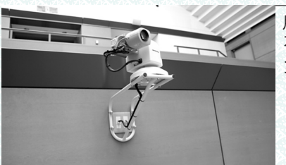
インターネット中継用カメラ