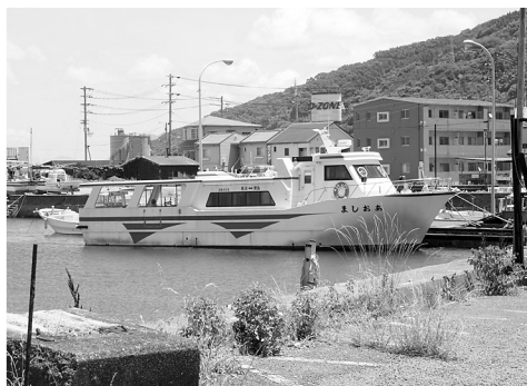
青島との定期連絡船「あおしま」

答 昨年の欠損金は約3,530万円であり、国の補助を受け、残りの市の負担は約410万円です。