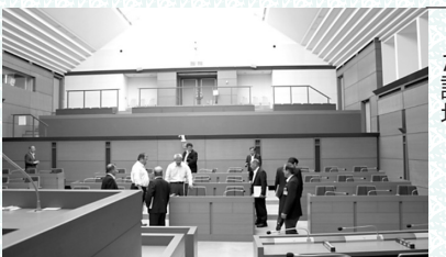
中継用カメラを設置した議場