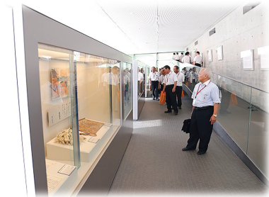
愛媛県市議会観光振興議員連盟 広域観光推進研修会 (坂の上の雲ミュージアム)