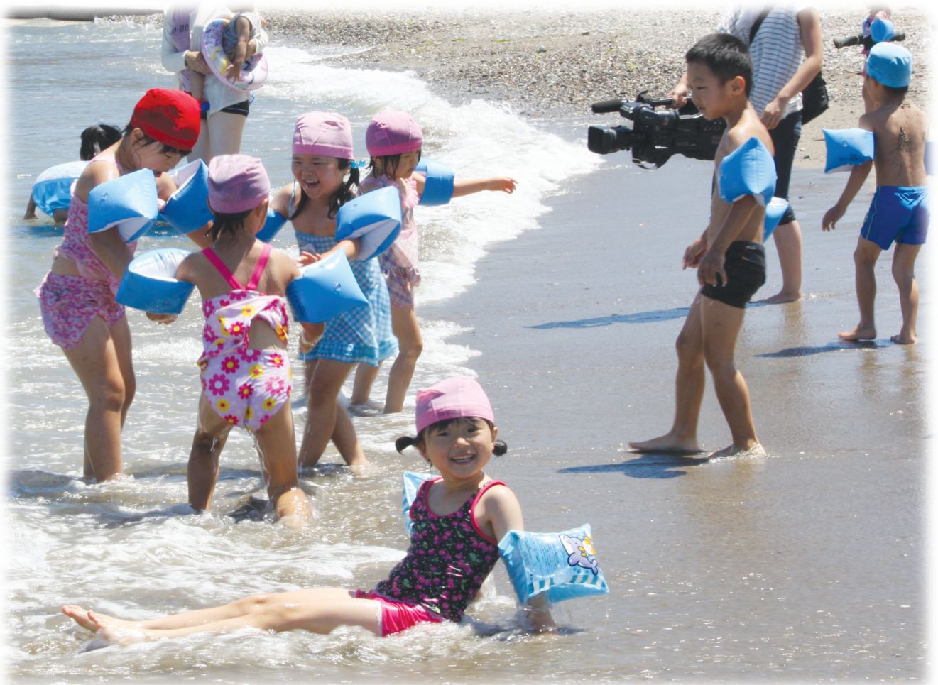
海開き（長浜海水浴場）

●発行 大洲市議会 〒 795-8601 愛媛県大洲市大洲 690 番地の 1 ☎ 0893-24-1730