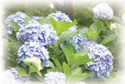
鹿野川園地のおじさい

さて、6月定例会も終わり、早いもので、平成25年も半年が過ぎました。今後も、大洲市の発展のため、皆様のご意見をいただきながら、議会の責務を果たしてまいりますので、よろしくお願いたします。