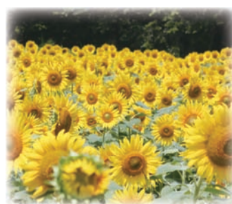
五郎のひまわり畑