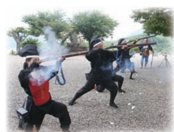
約150年ぶりに結成される 大洲藩鉄砲隊

今回の表紙は、JR四国の観光列車「伊予灘ものがたり」を取材させていただきました。さて、その表紙に、甲冑武者が写っているのにお気づきでしょうか。コスプレ？と思われるかもしれませんが、実は、今年、大洲城は復元10周年を迎えるので来客の方にPRしているとのことでした。また、8月31日には記念イベントが開催され、約150年ぶりに結成される大洲藩鉄砲隊がイベントを盛り上げます。観光列車の運行や大洲城復元10周年記念式典。今年も大洲の夏は暑いですが、これらのイベントも熱くなりそうです。