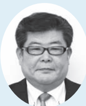
武田 雅司 議員