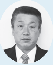
新山 勝久 議員