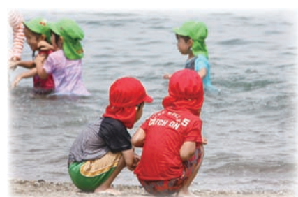
ちょっと、さむい!？ （長浜海開き）