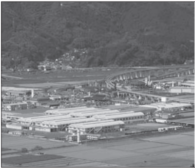
製造業等の立地が決まったパナソニック大洲工場跡地

加えて、市内の高校へも出向いて市内優良企業の紹介などに努めるとともに、大洲産業フェスタでは企業が若者に対し会社のPRを行う場として活用していたなど、市内企業の人材確保についても支援を行っています。