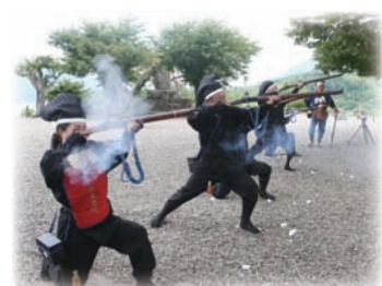
約150年ぶりに結成される 大洲藩鉄砲隊

今回の表紙は、JR四国の観光列車「伊予灘ものがたり」を取材させていただきました。さて、その表紙に、甲冑武者が写っているのにお気づきでしょうか。コスプレ？と思われるかもしれませんが、実は、今年、大洲城は復元10周年を迎えるので来客の方にPRしているとのことでした。また、8月31日には記念イベントが開催され、約150年ぶりに結成される大洲藩鉄砲隊がイベントを盛り上げます。観光列車の運行や大洲城復元10周年記念式典。今年も大洲の夏は暑いですが、これらのイベントも熱くなりそうです。