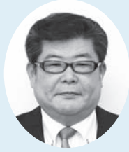
武田 雅司 議員