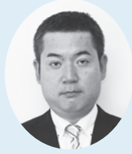
中野 寛之 議員