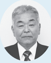
宮本 増憲 議員