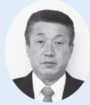
新山 勝久 議員